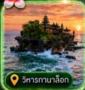
วิหารกานาล็อก