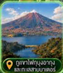
ภูเขาไฟบุงอากุง และทะเลสาบมาตอร์