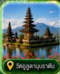
วัดอุลูคานูบราติน