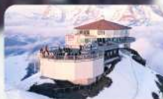
ทานอาหารที่ Piz Gloria ภัตตาคารที่หมุนได้ 360 องศา