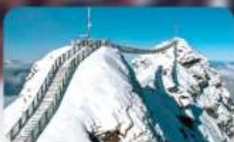
พิชิต 3 ยอดเขาดัง Rigi / Schilthorn / Glacier 3000