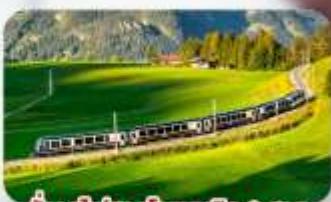
นั้งรถไฟสายโรเมนติก 2 สาย Golden Pass / Luzern Interlaken Express