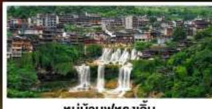
หมู่บ้านฟุทงเจิน