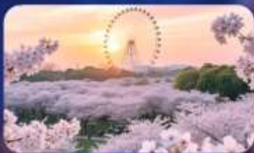
ซากุระบานสวน Gucun Park