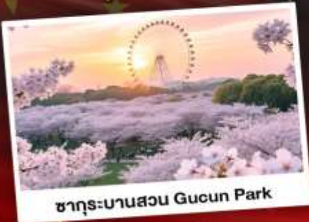
ซากุระบานสวน Gucun Park