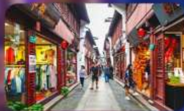
เมืองโบราณซีเป่า