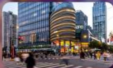
ถนนหนวยให้ลู่