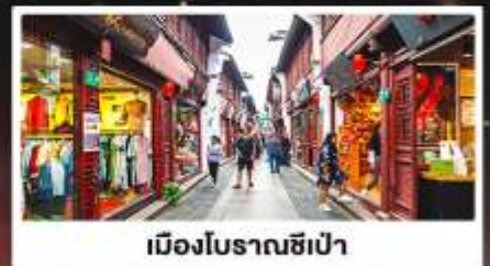
เมืองโบราณซีเป่า