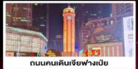
ถนนคนเดินเจียวฟางเปี่ย