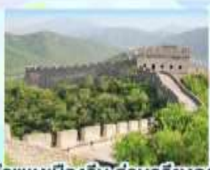
ตลาดร้อยปีเฉิงหวงเหมียว กำแพงเมืองจีน ด้านจียิงทงวน