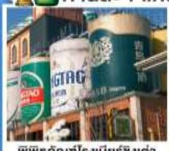
พิพิธภัณฑ์เบียร์ชิงเต่า