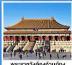
พระราชวังต้องห้ามปักกิ่ง