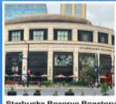
Starbucks Reserve Roastery