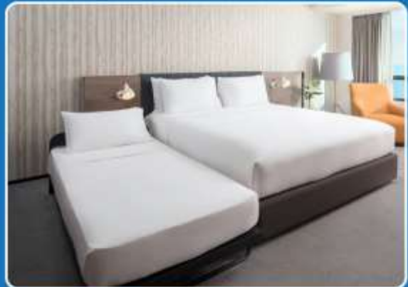
👤👤+👤 TRIPLE (TRP)

**รูปภาพห้องพักเป็นเพียงภาพสื่อถึงประเภทของเตียงเท่านั้น ไม่ใช่ภาพห้องพักจริงสำหรับการเข้าพัก**