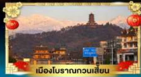
เมืองโบราณกวนเสียน