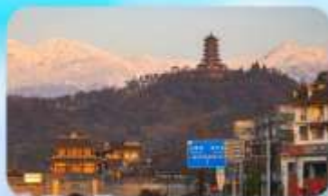
เมืองโบราณกวนเสี้ยน