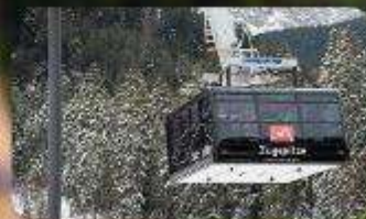
นั่งกระเช้าซูกสปีตซ์