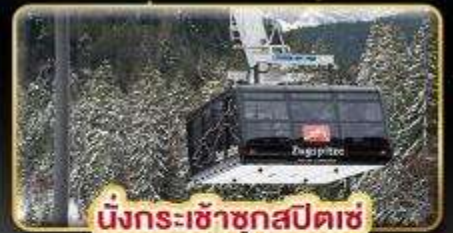
นั่งกระเช้าชุกสปีตซ์