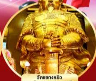
วัดเขกงกิว ขอพรโชคลาภ การเงิน และสุขภาพ