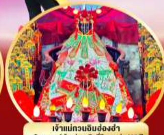
เจ้าแม่กวนอิมฮ่องกง นมัสการองค์เจ้าแม่กวนอิมที่มีอายุกว่า 600 ปี