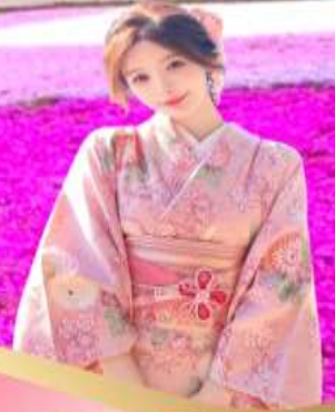
ช้อปปิ้งชินโซบาสึ