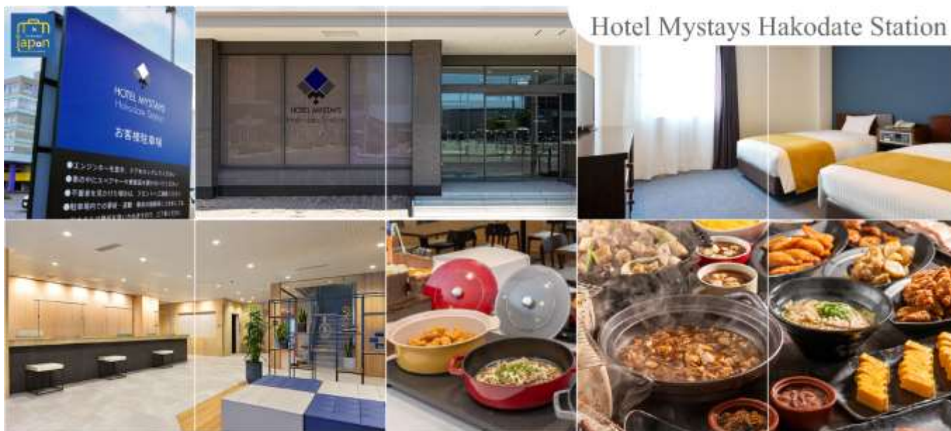
Hotel Mystays Hakodate Station

HOTEL MYSTAYS HAKODATE STATION, HAKODATE หรือเทียบเท่าระดับเดียวกัน