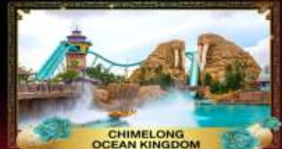
CHIMELONG OCEAN KINGDOM