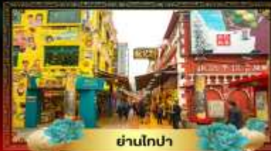
ย่านโกปา