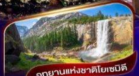
อุทยานแห่งชาติโยเซมิตี