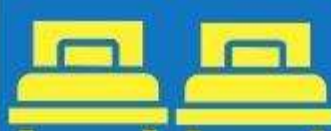
ห้องพักเตียงคู่ TWIN