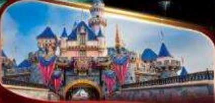
ดิสนีย์แลนด์พาร์ค