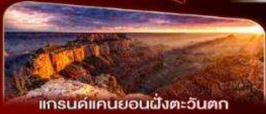
แกรนด์แคนยอนฝั่งตะวันตก

พักลาสเวกัส 2 คืน เต็มอิ่มกับแสงสีแห่งอเมริกา