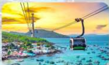
Hon Thom Island