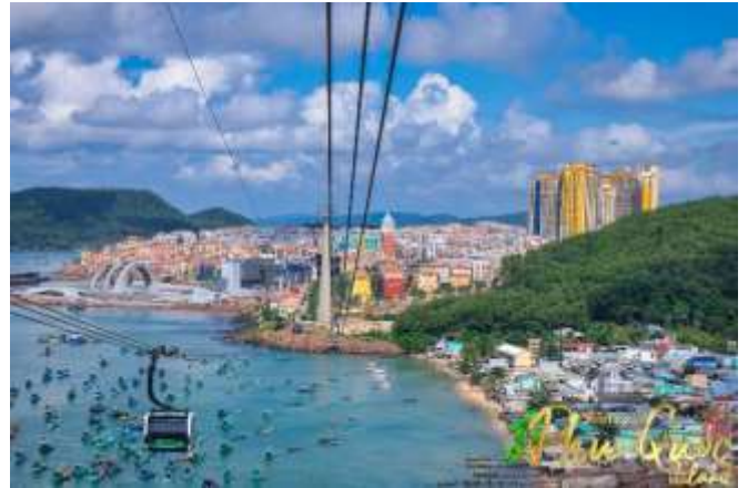
Sun World Hon Thom Nature Park พบกับ

เดียวของเวียดนาม (สำหรับท่านที่สนใจเล่นสวนน้ำ กรุณาเตรียมชุดสำหรับเล่นน้ำ 1 ชุด)