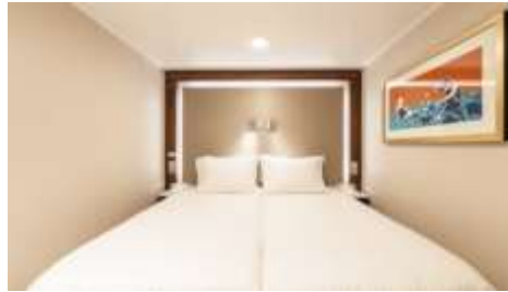
พัก 1-2 ท่าน

From 13 - 14 sq.m Max Occupancy 2-4 A Deck 5/8/9/10/11/12/13/15 2 Single Beds / 2 Single Beds + 1 Ceiling Pullman Bed / 1 Single Bed + 1 Pullman Bed + 1 Double Sofa Bed