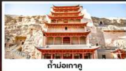
ถ้ำม่อเกาตุ