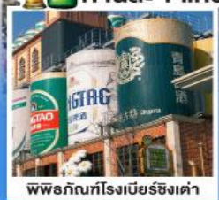
พิพิธภัณฑ์โรงเบียร์ชิงเต่า