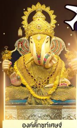
องค์ดีกษุท์เศษฐ์