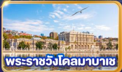
พระราชวังโดลมาบาซ