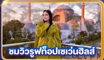
ชมวิวยุฟทือปเซเวนฮิลส์