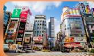
ซ้อปปิ้งชินจูกุ