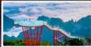
กุเวา 7 ดาว