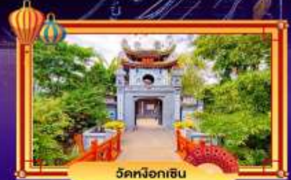
วัดนพอกอิน