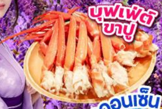
บุฟเฟ่ต์ ซาซึมิ