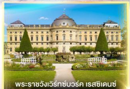
พระราชวังแวร์ทซ์บวร์ค เรสซิเดนซ์