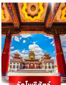
วัดโพธิ์สัตว์