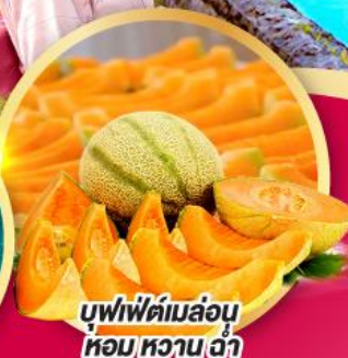
บุฟเฟ่ต์เมล่อน หอม หวาน ฉ่ำ