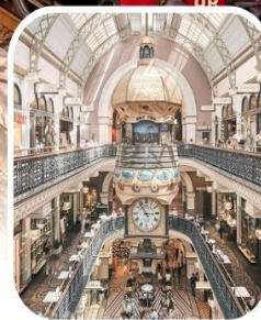
QUEEN VICTORIA BUILDING