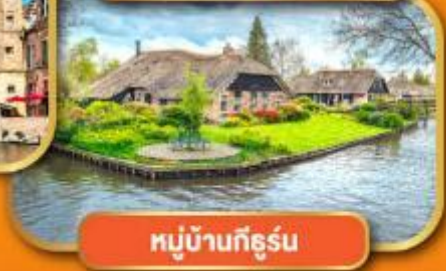
หมู่บ้านก็ธูร์น