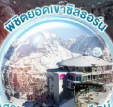
พิกคยอดเขาชีลอร์น