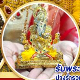
รับพระพิฆเนศวร ปางรำรอย ท่านละ 1 องค์