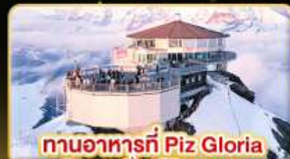
ทานอาหารที่ Piz Gloria