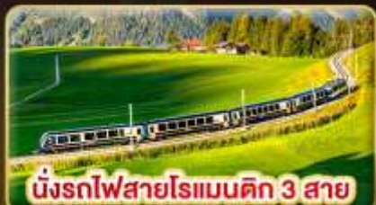
นั่งรถไฟสายโรแมนติก 3 สาย

เดินทาง: 5-12 เม.ย. | 31 พ.ค.-7 มิ.ย. 69