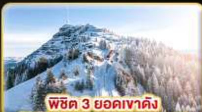
พีชิต 3 ยอดเขาดัง

Golden Pass / Luzern Interlaken Express / Gornegrat